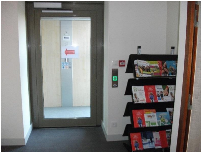
L'élève à l'étage