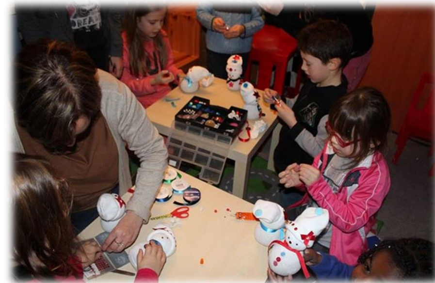
Atelier création bonhommes de neige pour les enfants de Mondreville

Il était de passage le jeudi 3 décembre sur la place de l'Eglise de Mondreville.