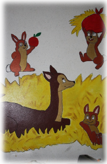
Le dortoir, école maternelle